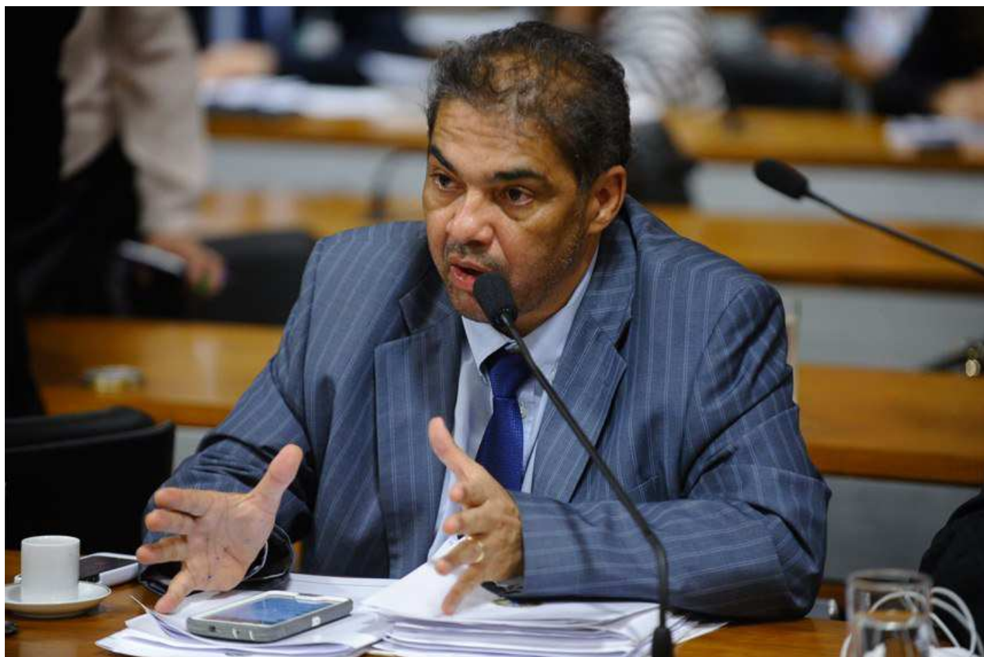
Marcos Oliveira/Agência Senado

Da Redação | 08/09/2015, 10h00 – ATUALIZADO EM 08/09/2015, 15h47